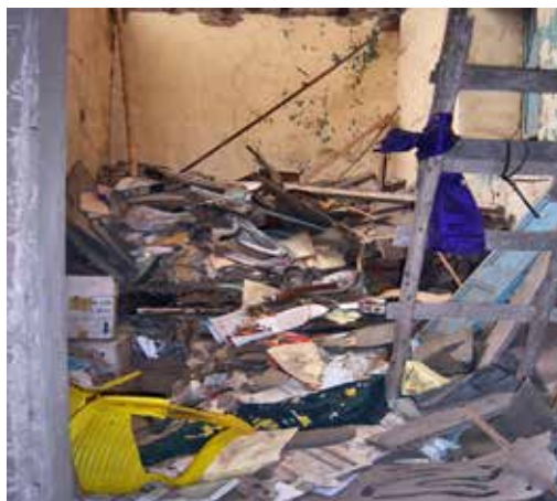
Fotografías N.º 1 y N.º 2. Ambiente donde se encontraba la documentación de la CCP.