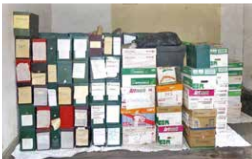
Fotografías N.º 7 y N.º 8. Colocación de los documentos en cajas archiveras.

la tarea de elaborar un cuadro de clasificación orgánico funcional.