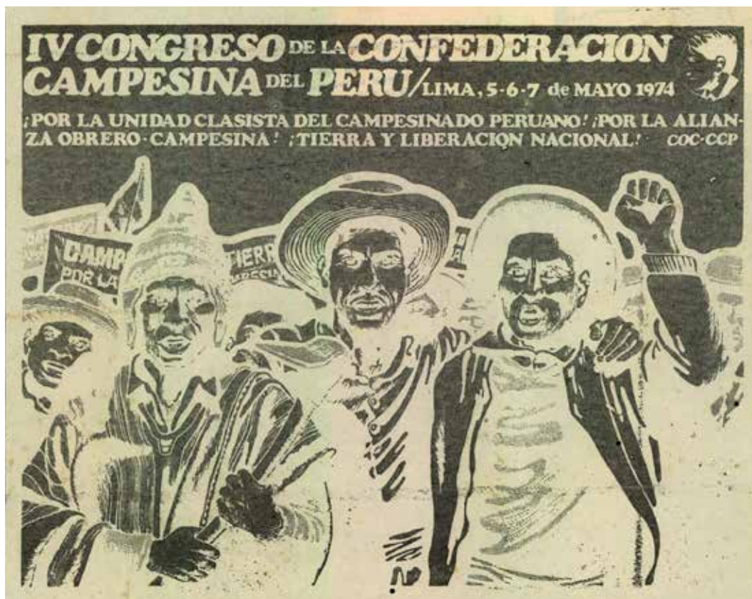
Figura N.º 1. Afiche del IV Congreso CCP de VR.

por diferencias con Saturnino Paredes– donde se aprecia el enfrentamiento entre los seguidores de Paredes y los activistas del grupo de izquierda Vanguardia Revolucionaria (VR). El resultado de este enfrentamiento fue el retiro de los delegados de la CCP a los simpatizantes de VR, quienes acusan a Paredes y sus seguidores de entregar credenciales a demasiados campesinos de Eccash, como también del manejo sectario en la conducción del congreso de