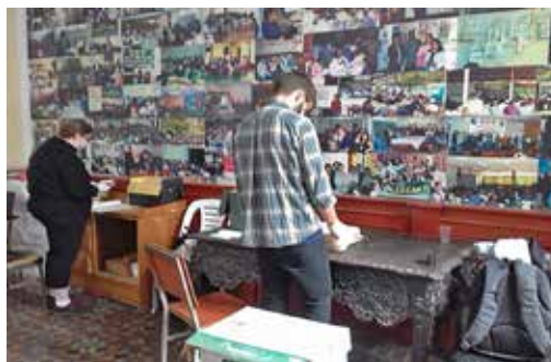
Fotografía N.º 9. Investigadores revisando la documentación.

Durante el año 2014, se realizó la digitalización de los afiches de la CCP que permiten visualizar el periodo del CAI y se entregó una copia al Centro de Documentación e Investigación