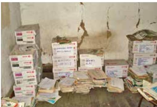
Fotografías N.º 3 y N.º 4. Labores de limpieza y colocación en cajas de cartón de la documentación.

con desmonte y en un estado de abandono total. Ante esta situación, se les planteó realizar el trabajo de rescate y puesta en valor de su documentación, por considerarla valiosa para la institución y la historia del movimiento campesino en el Perú. Obtenido el permiso, se inició el trabajo con los alumnos de la Escuela Académico Profesional de Historia de la UNMSM.