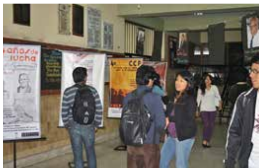
Fotografía N.º 10. Exposición de afiches de la CCP y CGTP.

(CDI) del Lugar de la Memoria, la Tolerancia y la Inclusión Social (LUM). Hoy se encuentra disponible en la plataforma virtual del mismo. 17