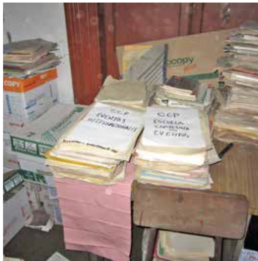
Fotografías N.º 5 y N.º 6. Trabajo de revisión y elaboración de cuadro de clasificación con las series documentales provisionales.