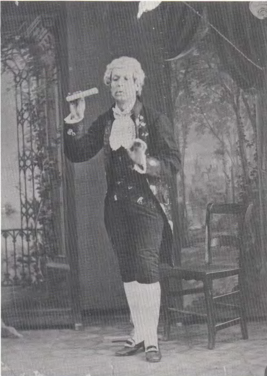
El actor español Felipe Abella, en una de sus caracterizaciones.