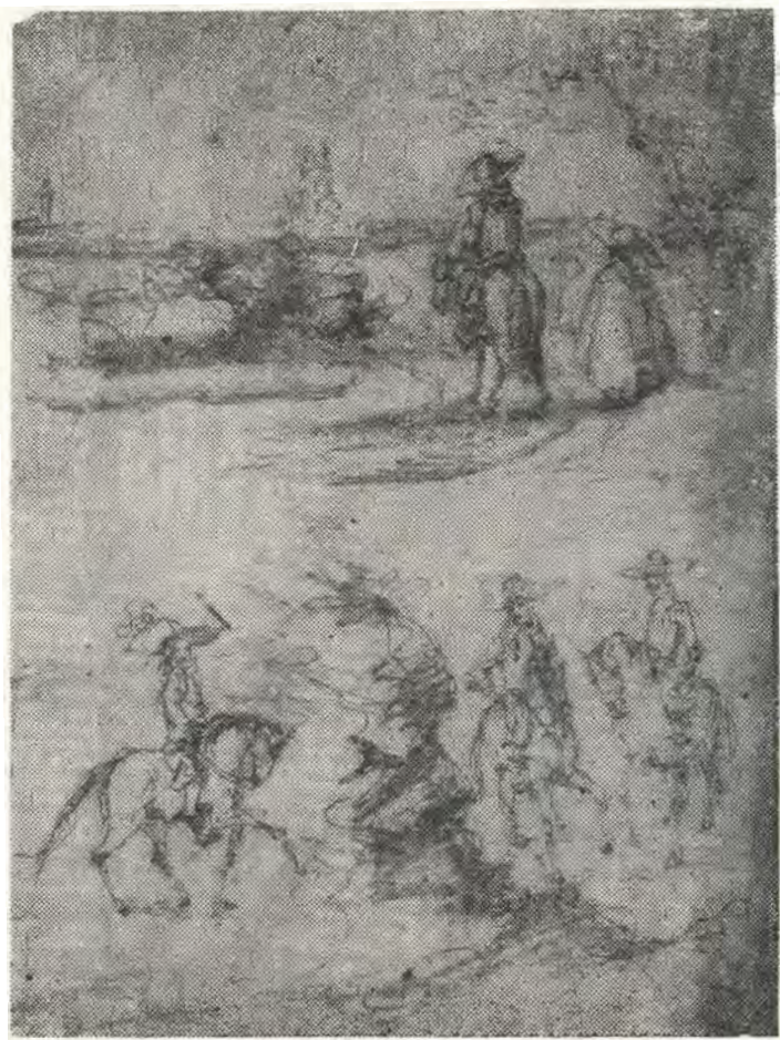
12.— Caballeros del siglo XVII, lápiz, Ignacio Merino.