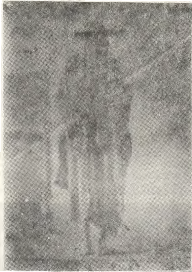
Fotografía utilizada por Francisco Laso, para el cuadro " El Hara. v:cu o La Pascana " - Palacio de Gobierno - 1868.

Dos de los apuntes que se encuentran en el Museo, muestran a una pareja del siglo XVII, en coloquio amoroso los cuales tienen cierta semejanza con los "Paseos en la Alameda Nueva", de Rugendas.