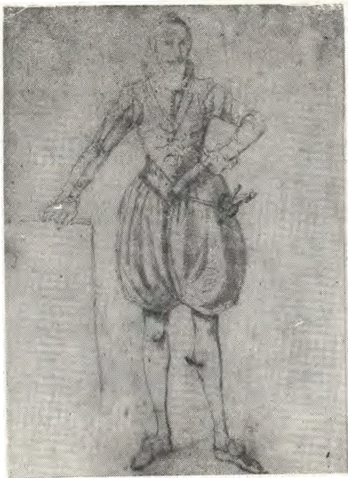
8.— Caballero del siglo XVI, lápiz, Ignacio Merino.