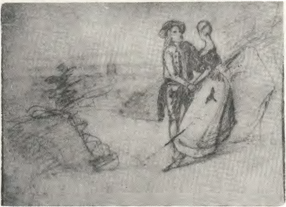
4.— Escena amorosa, lápiz y carboncillo, Ignacio Merino.