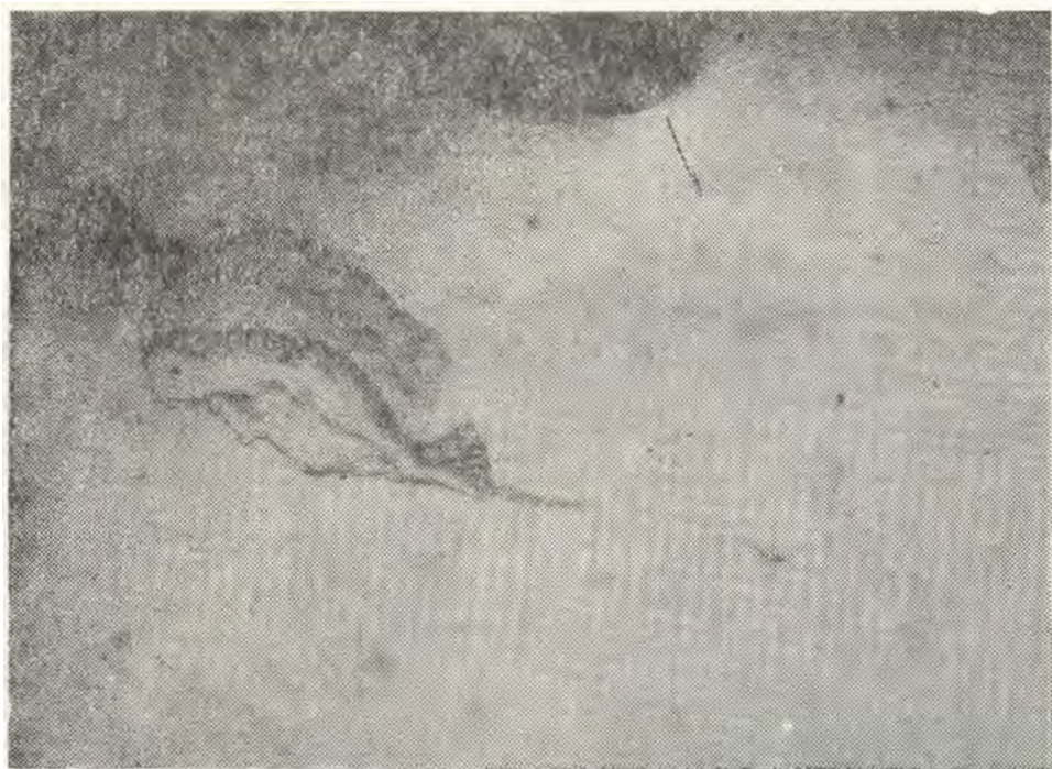
2. — Hombre con turbante, lápiz, Ignacio Merino.