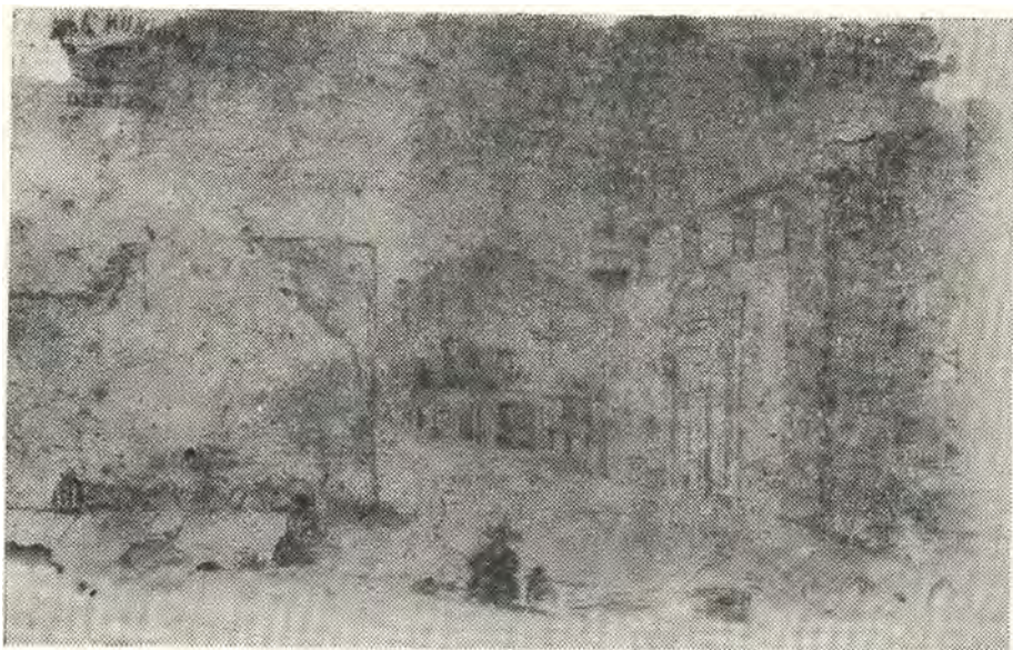
1.— Plazuela de la Chacaria . Acuarela Ignacio Merino, 1842.

grupo de cinco indios, cuatro de ellos sentados y uno de pie de espaldas al espectador, en tanto que los otros están en semicírculo escuchando al Haravicu o Narrador.