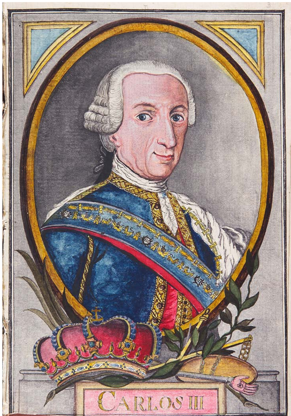
Imagen 20. Retrato de Carlos III. En Martínez Compañón, Trujillo del Perú , vol. 1, fol. 3.