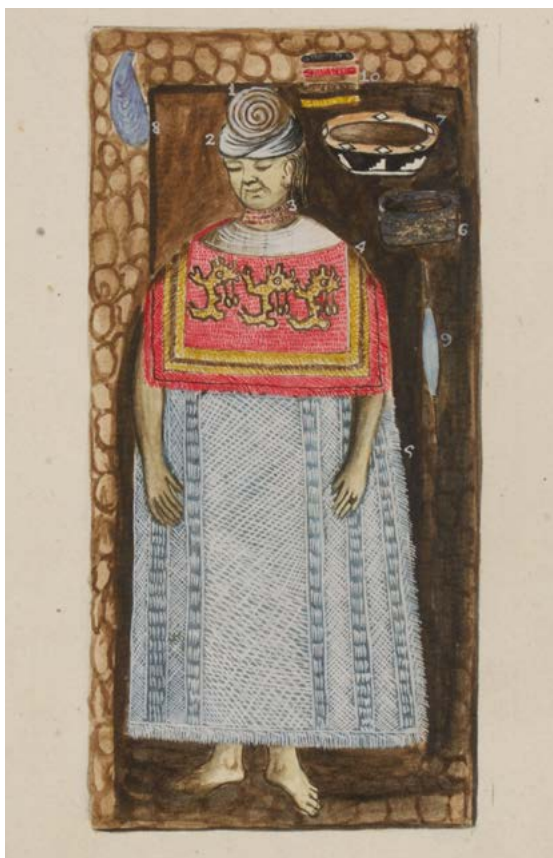
Imagen 21. Representación del entierro de una mujer andina con ajuares funerarios. En Martínez Compañón, Trujillo del Perú , vol. 9, fol. 15.

La influencia de Herculano y Pompeya constituyó apenas un aspecto de la compleja iniciativa arqueológica de Martínez Compañón. El interés de Carlos III por las antigüedades sirvió sin duda de ímpetu para el obispo, pero es instructivo considerar de qué maneras el Volumen 9 resultó arqueológicamente innovador. Un interés por la estratigrafía, si bien modesto en Trujillo del Perú , no fue siquiera una consideración en las excavaciones vesubianas hasta el siglo XX. Una examinación de objetos in situ también fue apenas un aditamento en las excavaciones borbonas en Pompeya y Herculano. 69 Sin embargo, las acuarelas de Volumen 9 revelan un interés marcado por la documentación del contexto de artefactos, en entierros (Imagen 21)