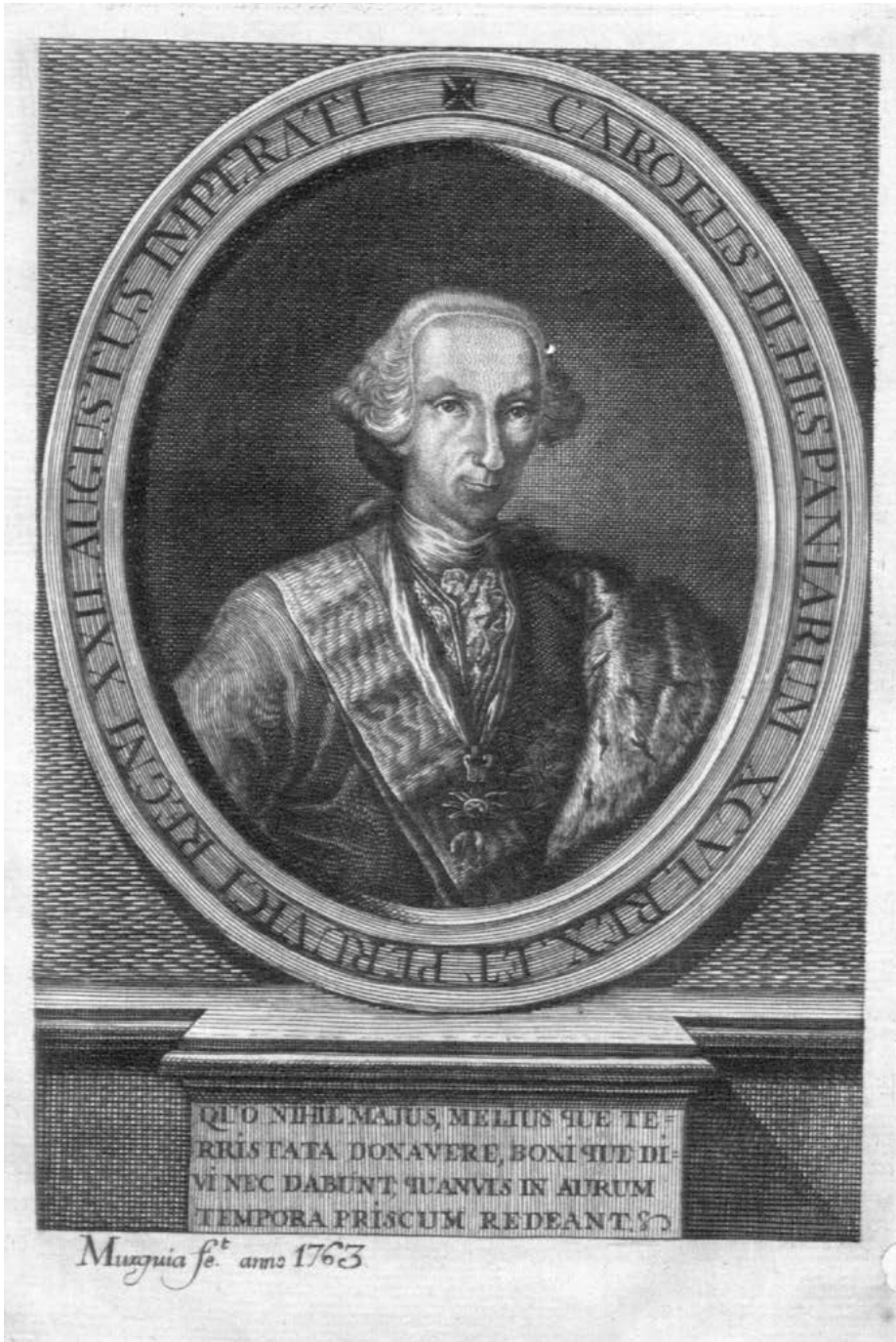
Imagen 19. Retrato de Carlos III. En Feijoo [Feyjoo] de Sosa, Relación descriptiva , frontispicio.